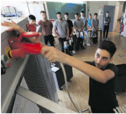
Bei einem Rundgang an der Schule haben die neuen Berufsfachschüler die Labore und Lernräume anschauen können.