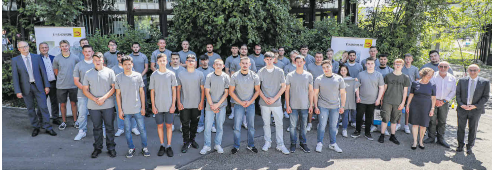
Die angehenden Elektroniker wurden in der Gewerblichen Schule in Göppingen bei einer Veranstaltung mit der Innung und der Gewerblichen Schule Geislingen begrüßt.

Die Schule beginnt offiziell zwar erst im September, dennoch wurden die angehenden Elektroniker nun bei einer gemeinsamen Veranstaltung im Berufschulzentrum in Göppingen begrüßt.