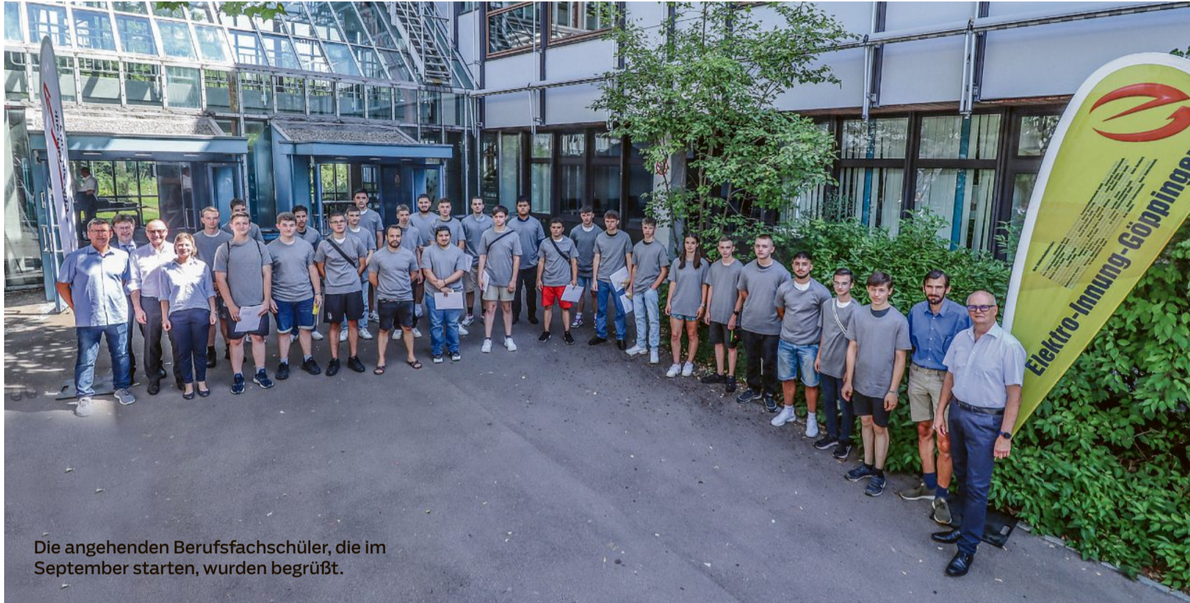
Die angehenden Berufsfachschüler, die im September starten, wurden begrüßt.