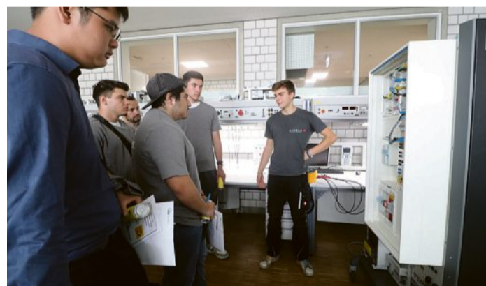
Bei der Veranstaltung haben die Berufsfachschüler auch einen Einblick in die Werkstätten an der Gewerblichen Schule in Göppingen erhalten und konnten sich bei Auszubildenden informieren, was sie in den kommenden Jahren erwartet.